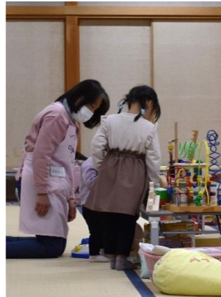
▲折り紙、持って帰ってね。

さんだおもちゃライブラリー＝総合福祉保健センター3階集会室、原則 毎月第2・第4金曜日、10時～12時。光永さん ☎090-3488-3422