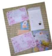
▲かわいらしいお手紙をいただくことも！