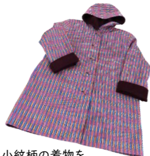
小紋柄の着物をリバーシブルのフード付きコートに!

着物以外にも好きな生地を持って来て制作してもOK。興味のある方はぜひ2、3度見学してみてください♪